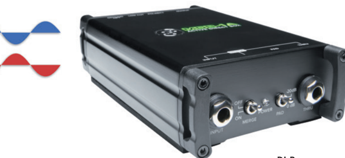
DI-Boxen symmetrieren das unsymmetrische Signal

Wegen der hohen Signalstärke können Lautsprecherkabel grundsätzlich auf eine Abschirmung verzichten, wogegen der Leiterquerschnitt hier an Bedeutung gewinnt. Gute Lautsprecherkabel sind zweifadrig und haben neben qualitativ guten