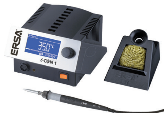
Mit einer mobilen Lötstation sind Kabeldefekte auch auf Tour schnell zu beseitigen