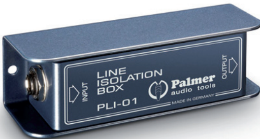
Ein Line-Isolator kann vor Brummschleifen in unsymmetrischen Verbindungen schützen

Steckverbindern einen hohen Leiterquerschnitt. Als Steckverbinder werden meist 6,3 mm Mono-Klinkenstecker oder Neutrik Speakon-Stecker verwendet. Aber Vorsicht: Auch wenn unsymmetrische Instrumentenkabel manchmal äußerlich sehr ähnlich aussehen, so sollten sie doch niemals als Lautsprecherkabel verwendet werden. Wenn äußerlich – etwa durch den Kabel-Aufdruck – nicht zu erkennen ist, ob es sich um ein Lautsprecherkabel oder ein Instrumentenkabel handelt, einfach den Mono-Klinkenstecker öffnen und das Kabel prüfen: Hat das Kabel eine Abschirmung und einen Leiter in der Mitte, dann ist es ein Instrumentenkabel. Entdeckt man im Stecker keine Abschirmung, sondern nur zwei einzeln isolierte, gut dimensionierte Signalleiter (meist grau und weiß isoliert), dann ist es ein Lautsprecherkabel.