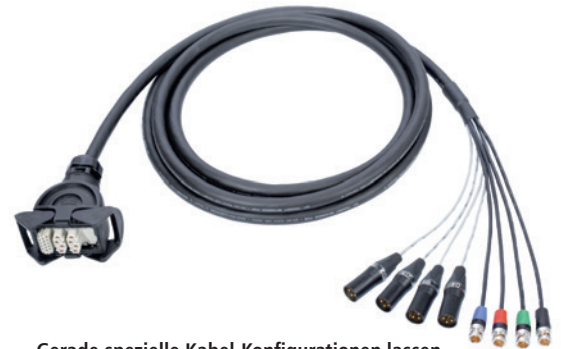
Gerade spezielle Kabel-Konfigurationen lassen sich recht günstig selber konfektionieren

Praxis-Tipp: Auch ein gut abgeschirmtes, symmetrisches Mikrofon-Kabel, das neben der Abschirmung zwei Signal-Leiter beinhaltet, lässt sich durch Zusammenschließen der beiden Signalleiter als unsymmetrisches Kabel verwenden. Sollte durch mechanische Beanspruchung des Kabels einer der beiden Leiter brechen, funktioniert das Kabel trotzdem noch über den